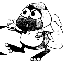
横浜市水道局キャラクター はまピョン