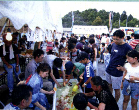
■ スタートから大盛況

緑園連合自治会主催の平成26年緑園夏祭りが8月2日緑園東小学校で開催され、緑園一丁目からも青少年部を中心に、子供会役員、子供たち、そして一丁目有志の方が多数参加され、恒例の金魚すくい、スーパーボールすくいを出店しました。当日は、晴天にも恵まれ17時の開始とともにどのお店にも長蛇の列ができ、大盛況でした。大人たちは盆踊りよりお酒？、子供たちは多くの模擬店などで楽しめた夏祭りでした。当日、ご協力いただきました皆様に感謝申し上げます。(広報部:粟竹)