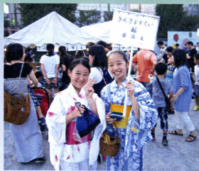
■ お手伝い ありがとう