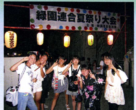
■ この春卒業の同窓生たち