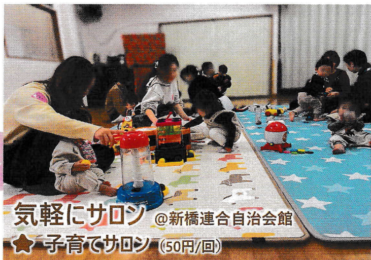
気軽にサロン @新橋連合自治会館 ★ 子育てサロン (50円/回)