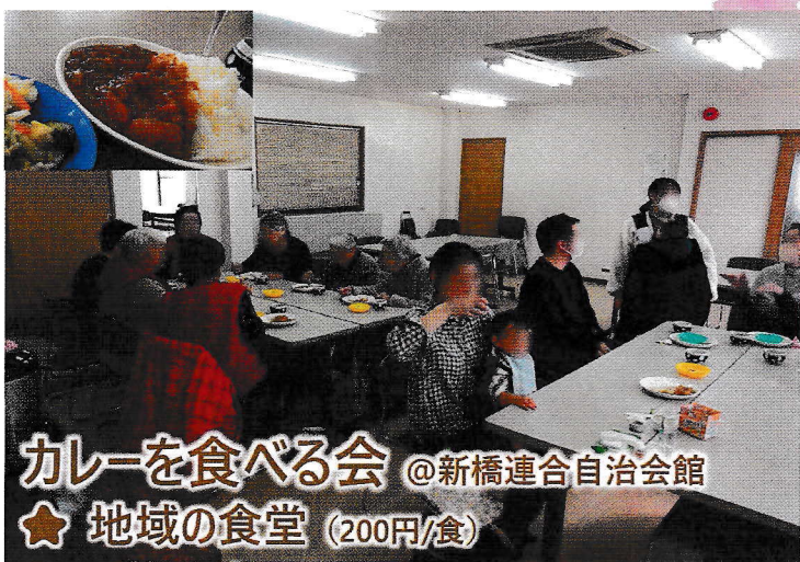
カレーを食べる会 @新橋連合自治会館 ★ 地域の食堂 (200円/食)