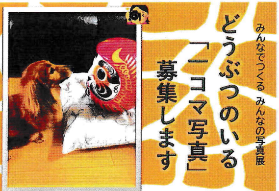
5月18日(土)から5月26日(日)まで新橋地域ケアプラザにて動物の写真テーマとした写真展を開催。みんなに見てほしいと思う お気に入りのどうぶつ写真をご応募ください。

応募資格 どなたでも応募できます。 募集内容 ・どんなかたちであれ、どうぶつが写っている写真。 ・ご本人が撮影した写真であること。(特撮した写真でも大歓迎) ・著作権に違反する写真、公序良俗に反する写真、他人のプライバシーを侵害する写真のいずれでもないこと。 ・おひとりさま2点まで応募できます。 募集期間 2024年3月18日(月)10時～2024年4月30日(火)16時まで 応募方法 お手数をおかけしますが、ご自分で、A4サイズに印刷して、ケアプラザ受付カウンターに持参していただくか、ご郵送ください。 なお、応募に伴い発生した費用はすべて応募者が負担するものとしてお願いします。 ★氏名、電話番号、写真タイトルを写真の裏面に記載してください。 ※応募いただきました作品の返却は、ご希望があれば対応するので応募時にお知らせください。 ※コンテストではありません。応募された写真を期間中に施設内での掲示し、地域の方に見学してもらう写真展となります。写真展の複製は無料で行います。 ※応募の時点で、応募者は本応募要項に記載の諸条件に同意したものとみなします。