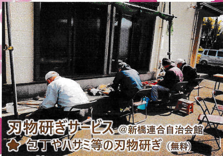
刃物研ぎサービス @新橋連合自治会館 ★ 包丁やハサミ等の刃物研ぎ (無料)

マップ内の場所で行われている、地域の様々な団体が運営する活動をほんの一部ですが、ご紹介いたします！