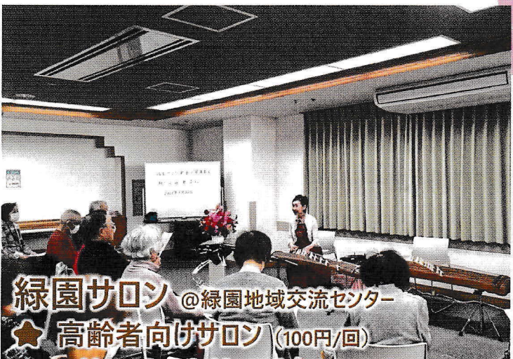
緑園サロン @緑園地域交流センター ★ 高齢者向けサロン (100円/回)