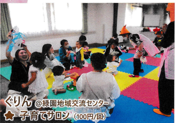
ぐりん @緑園地域交流センター ★ 子育てサロン (100円/回)