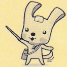
スリム 「ヨハマ3R夢！」マスコットイーオ