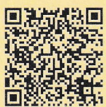
横浜市 粗大ごみ 2次元コード

※12月のお申込みは特に混み合い、 年内の収集にお伺いできない場合がございます。