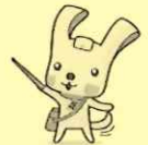
スリム 「ヨハマ3R夢！」マスコットイオ