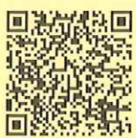
横浜市 粗大ごみ 2次元コード

※12月のお申込みは特に混み合い、 年内の収集にお伺いできない場合がございます。