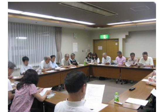
今年度の夏祭り実行委員会