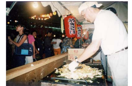
駅前で行っていた頃