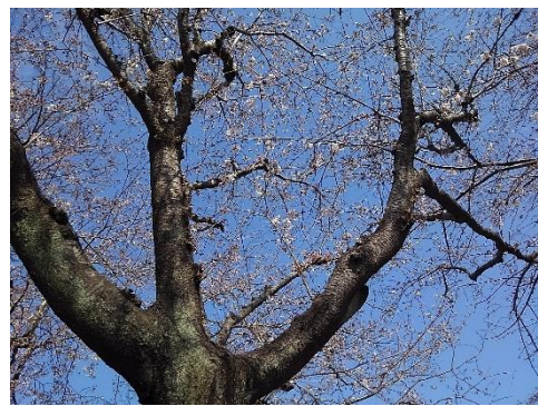
中田西一丁目公園のハナモモ