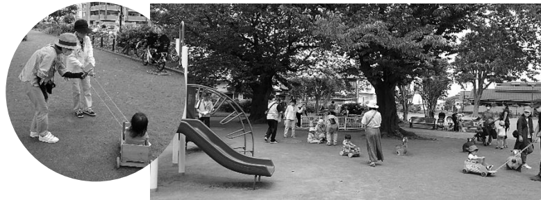
親子そろって楽しいひと時