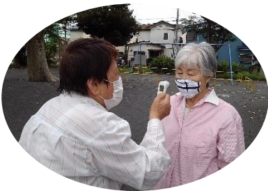
検温（保健活動推進委員）