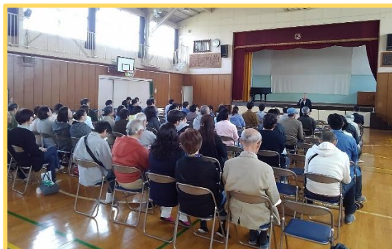
出席者のみなさん