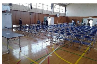
会場の設営と準備