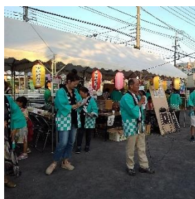
小山実行委員長挨拶