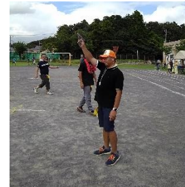
体育部のみなさん