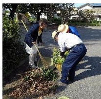
老人クラブ 社会奉仕の日