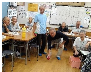
長寿会 ペタンク大会