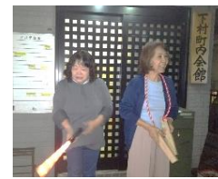
小塚会長も参加 鈴木副会長は防犯指導