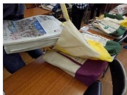
各組の袋へ 入れます