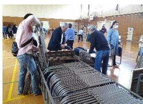
総会終了後は全員で後片付けです