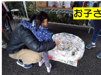
お子さんは「お菓子釣りゲーム」