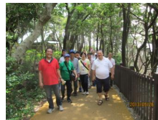
全員ウォーキングです