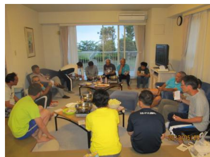
ペタンク研修：座学