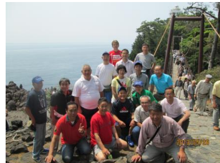
ウォーキング研修（城ヶ崎）