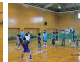
ドッチボール・卓球